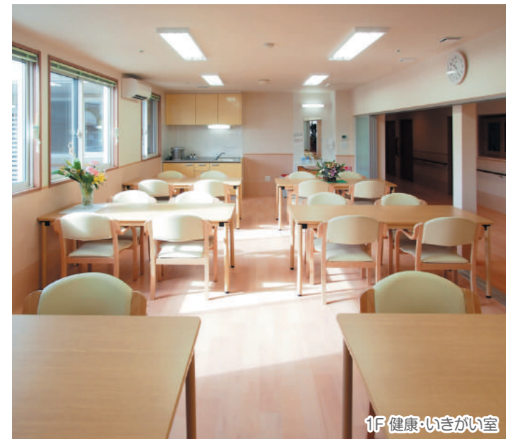
1F 健康・いきがい室

専門スタッフ(ホームヘルパー)が居室やお宅を訪問、ケアプランに基づき、食事・入浴・排泄等の身体介護や生活援助を行う介護支援サービスです。施設に事業所が併設されており安心してご利用いただけます。